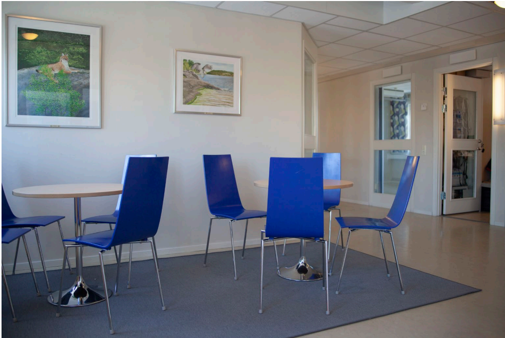
Gemensamma utrymmen i kontorsgemenskapen.