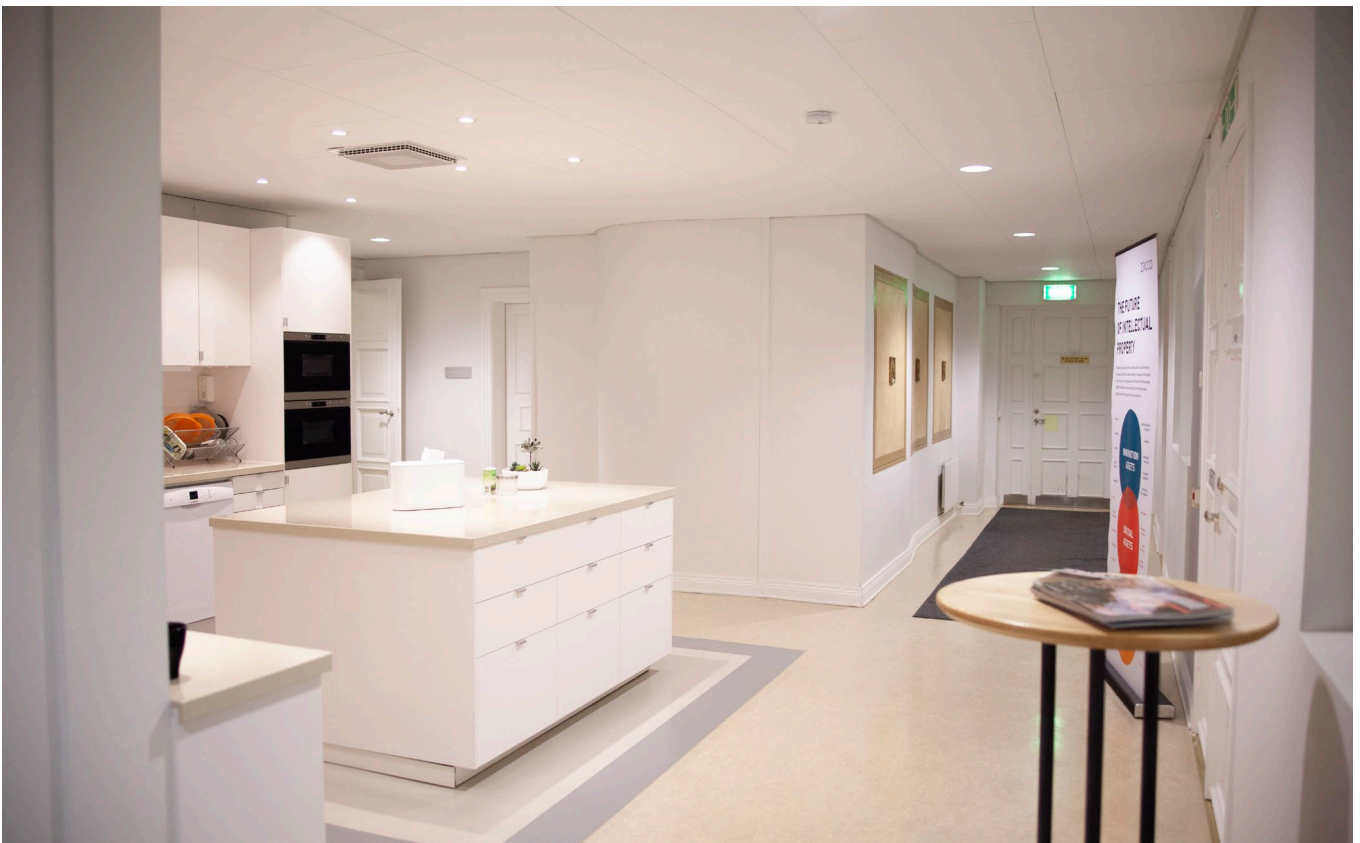
Kyrksalen, väggrelief och köket.