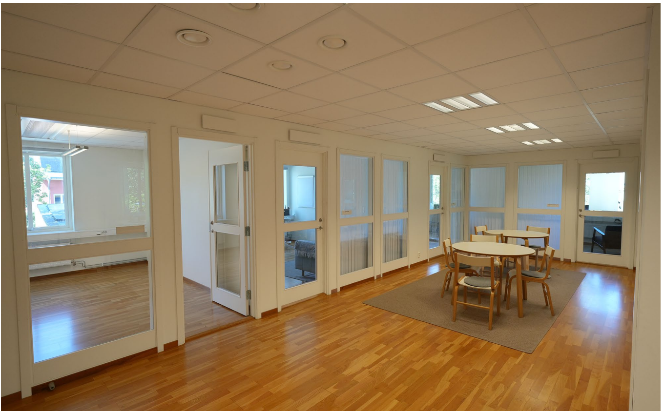
Pentry, WC och matsal.