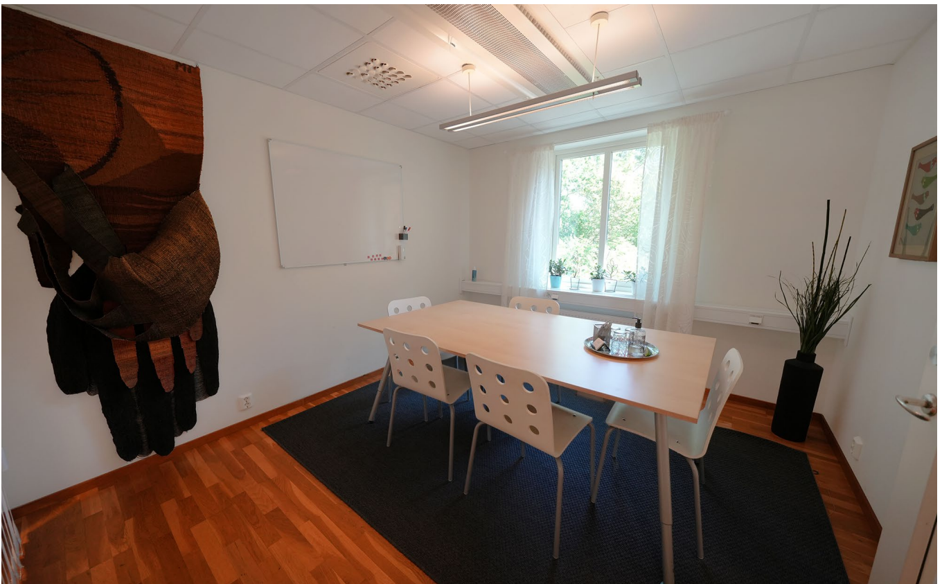
Kontorsrummet, utsikt, konferensrum.