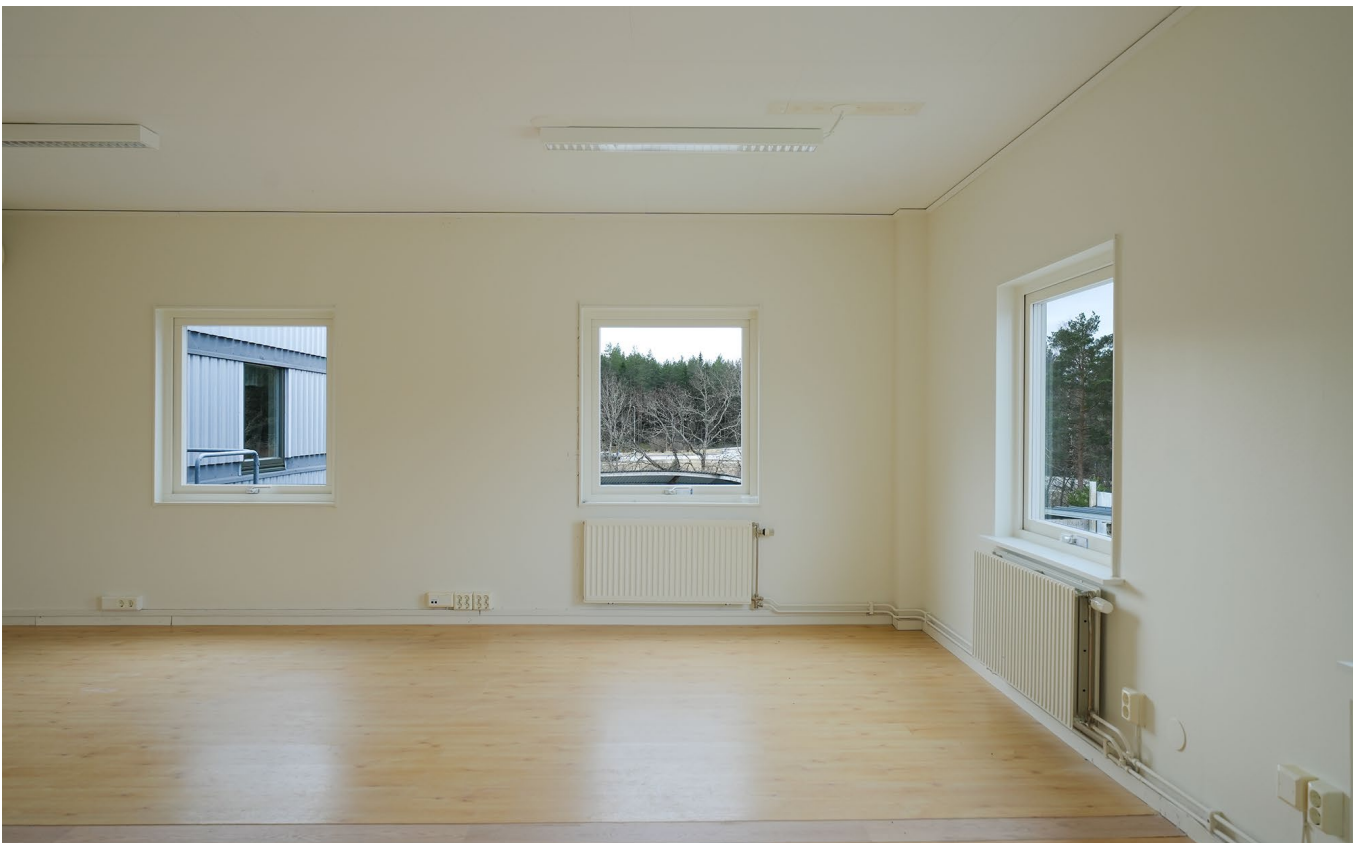
Kontorsrummet och pentry.