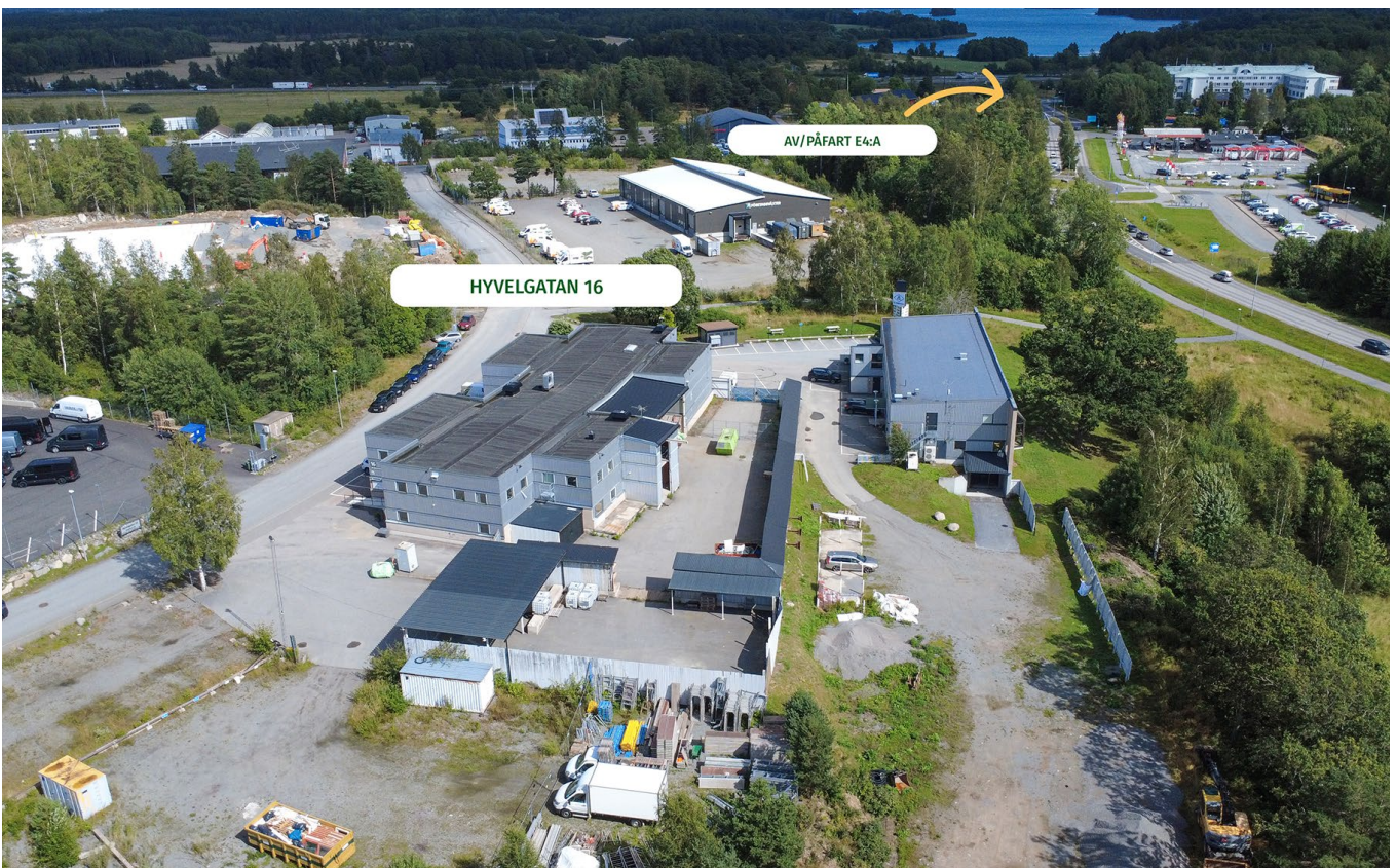
Uppställningsyta och fastighetens läge.