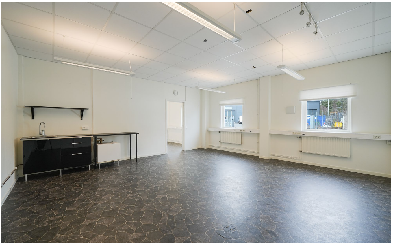
Kontoret och gemensamma pentryt.